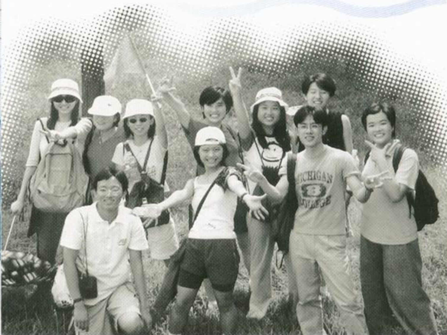
陽光燦爛，活力四射