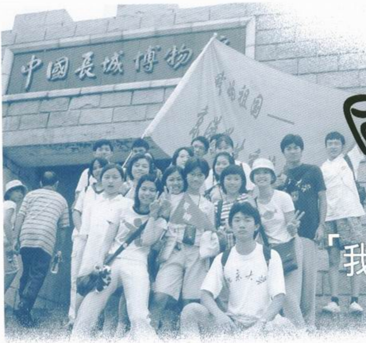
一眾京港「好漢」在長城高舉營旗真威風！