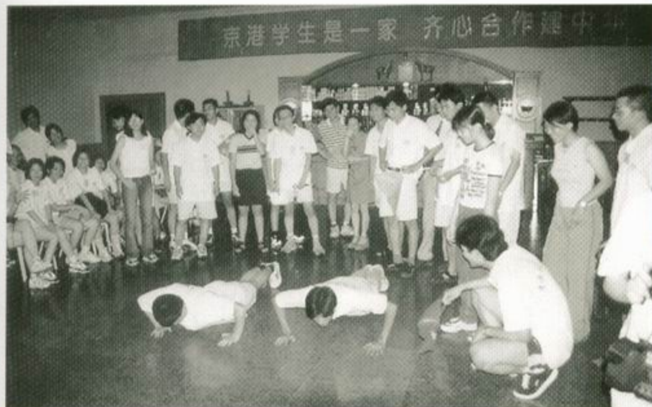
聯歡會上，京港學生大門「掌上壓」