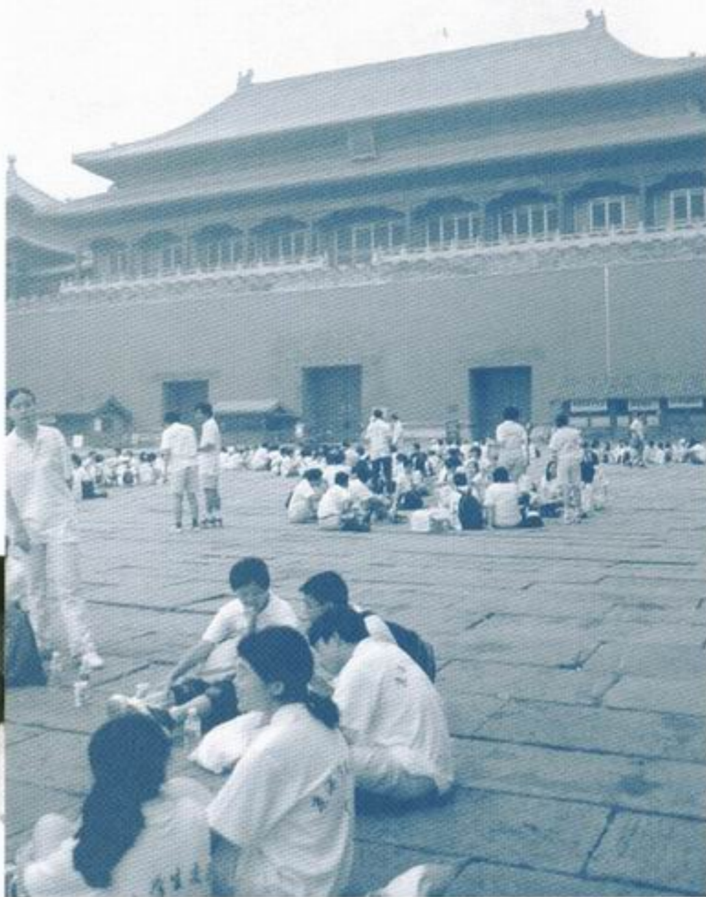
二百名營友在「午門」前齊進早餐

「我的祖國—京港學生交流營九九」已圓滿結束，但兩地營友所結下的情誼並未因為活動的結束而結束，反而是一個開始。從同學在機場惜別時緊抱不捨、揮淚相送的情景，我們相信兩地同學的友誼將會超越時空與地域的界限，永存心中。