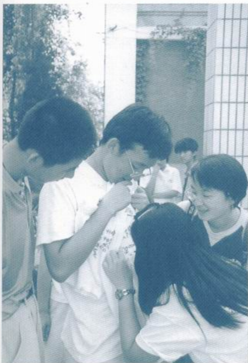
臨別依依，大家都在朋友們的營衣上簽名留念