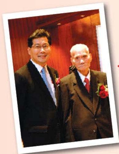
◀ 蘇局長非常敬重祖父，圖為他為祖父慶祝百歲大壽。