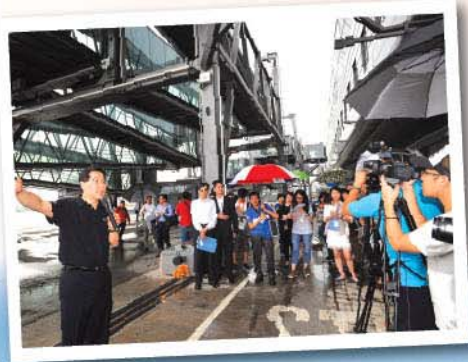
◀ 蘇局長向傳媒介紹新落成的啟德郵輪碼頭。

蘇局長給人的感覺溫文有禮，在訪談中不吝分享自己在成長過程中遇到的挫折和尷尬時刻，最令人印象深刻的莫過於局長提到現在的工作。即使現在局長的工作量和責任比當律師時更為繁重，亦甚少私人時間，局長仍然十分享受現在的工作。對蘇局長而言，這不只是一份工作，而是為香港長遠發展努力和付出，這種使命感和對自己認定的事物所付出的決心，十分值得我們學習和反思。