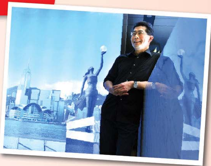
▲ 蘇局長在商務及經濟發展局辦公室接待處留影。

童年時代的經歷除了令蘇局長學會尊重別人、接納差異外，亦令蘇局長學懂如何取長補短，從而令自己更進一步。「每人都會有長短處、強弱項，我們要懂得如何有目的地改善自己的弱項。」蘇局長童年時的英文雖然較為遜色，但現在的他，英文反而較中文更好。他指出，這樣的成果全因他有計劃地改善弱項、發揚強項。