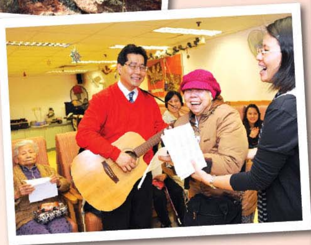
▲ 蘇局長探訪護理院，與長者歡唱聖誕歌。