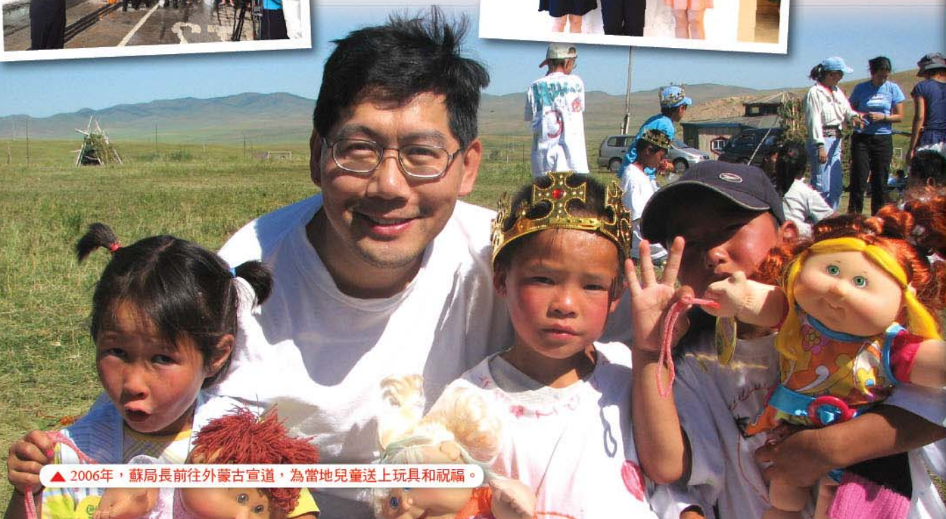
▲ 2006年，蘇局長前往外蒙古宣道，為當地兒童送上玩具和祝福。