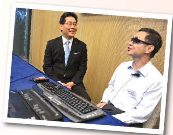
◀ 蘇局長了解無障礙網頁設計如何協助殘疾人士瀏覽網站。