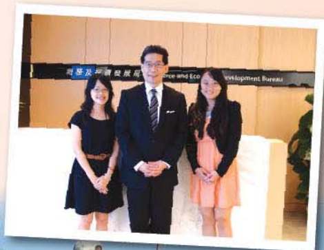
◀ 本會職員與蘇局長合影。