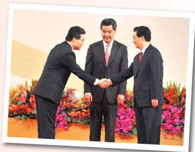
▲ 蘇錦樑局長在香港特別行政區第四屆政府就職典禮上與前國家主席胡錦濤握手。

近年，香港銳意發展科技創意。蘇局長認為發展科技創意是國際趨勢，而香港亦有絕對的優勢發展科技創意。