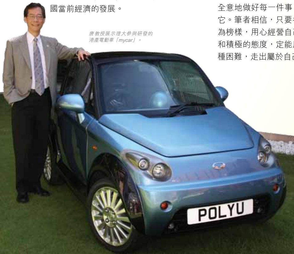
唐教授展示理大參與研發的港產電動車「mycar」。