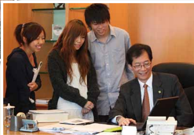
唐校長與學生相談甚殷。