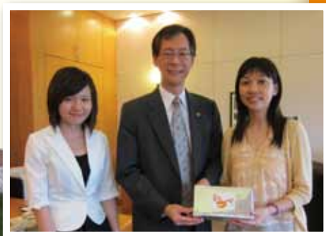
專訪結束後，本會同事致送紀念品給唐教授，感謝唐教授百忙之中抽空接受我們的專訪以及一直以來對本會的支持。

唐教授辦公室的牆上掛了一些家庭照，照片上唐教授和太太、兒女的臉上均洋溢著幸福、喜悅的燦爛笑容，讓筆者十分羨慕唐教授有個和睦美滿的家庭，同時亦為唐教授能在工作繁忙的同時兼顧好家庭感到非常佩服。筆者問唐教授：是否覺得要兼顧事業和家庭其實是一件辛苦的事？唐教授笑了笑，說：「我覺得不辛苦」。笑有很多種，唐教授的笑，是發自內心的笑。那一刻，筆者突然想起了那句「世上無難事，只怕有心人」。這句話正道出了唐教授成功的原因：用心地、全心全意地做好每一件事，無論是事業、家庭抑或其它。筆者相信，只要各位青年朋友都能以唐教授為榜樣，用心經營自己的學業或事業，抱著樂觀和積極的態度，定能用自己的勇氣和毅力克服各種困難，走出屬於自己的一片天。