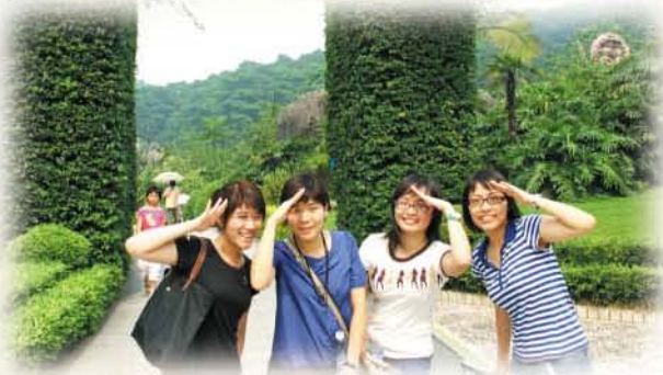
Hello! 大家好，我們的廣州之旅很開心呀！