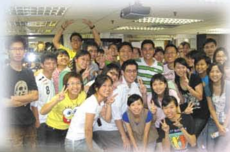
在啟航禮時，大家已經打成一片。

為了讓參加者更加熟絡，更深入的認識，大會於9月20-21日舉辦了兩日一夜的廣州考察團，透過在廣州參觀、考察、國情講座和小組分享會，一方面讓參加者對我國近代史和經濟發展有更多的了解，另一方面，讓各Mentor與Mentee分享彼此的意見和感想，使相互間有更深入的認識，增進友誼。