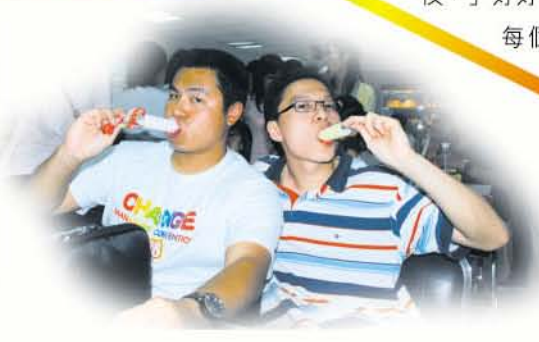
參觀明治雪糕廠時，我們還可以免費品嚐雪糕呢！

2009年，計劃還有一連串精彩的活動將會舉辦，而各組的Mentor和Mentee亦會不定期地組織小組聚會。我們相信，在一年的計劃中，只要大家全情投入，必定可以獲益良多，為人生寫下精彩的小章節。