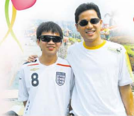
Albert和丁丁這對組合已經變成「難兄難弟」了。