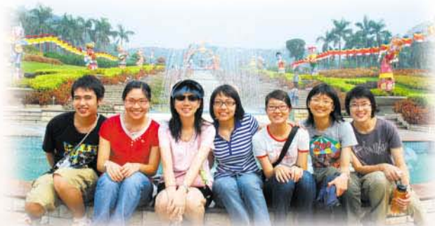
我們雖然來自不同小組，但早已打成一片，成為好朋友。

事實上，從得知這「領袖導航計劃」的導師都是有份量的人開始，我就對活動充滿期待，期待能夠從不同的導師身上學會更多，見識更多。這兩日一夜的活動令我體驗到了。原來區議員認真的背後有如此童真的一面，原來嬉戲笑臉下有見識廣博的意見。從別人身上學會的，一定比自己無目的地摸索要快得多。一個人的生命有限，要在有限的生命中吸取最多的知識，就是從別人的經驗中學習。而溝通分享的確是一個比閱讀更為有效的學習方法，因為溝通的互動性，能夠引發思考作出即時回應，更有助理解，所以在難得的講座及晚上的分享會中，我確實獲益良多，對自己的國家亦有了更深一層認識和反思。