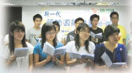
唱會歌是啟航禮的重要環節。