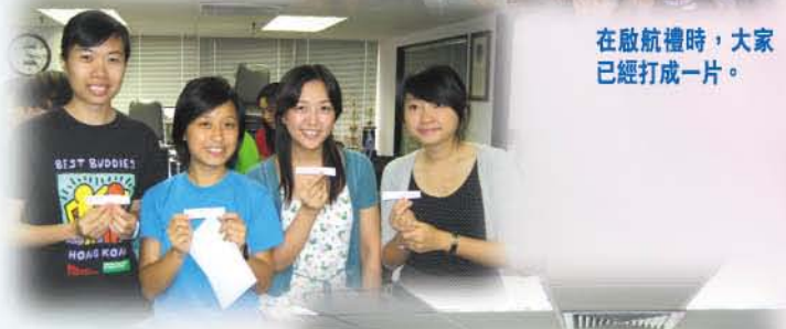
我們會積極分享，互相學習，共同成長。