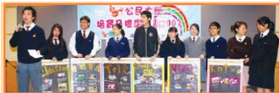
公民大使介紹自己製作的展板。