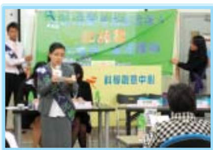
公民大使落力介紹自己的政綱。