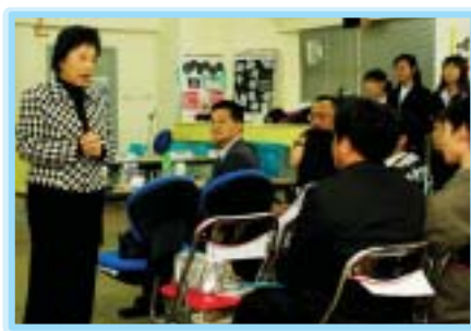
劉健儀議員與我們分享選舉論壇的辯論技巧。