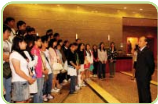
特派員公署詹永新副特派員勉勵公民大使。

我們又得到中華人民共和國駐港特派員公署的盛情接待，除了安排講座介紹公署的工作及參觀外交圖片展外，副特派員詹永新先生更親自接見我們，勉勵公民大使。計劃的重頭戲「模擬選舉論壇」更是公民大使發揮潛能的大好機會，他們分組代表不同的政黨，化身為模擬立法會選舉的候選人、智囊團及助選團，於論壇上介紹自己的政綱及互相質詢。我們更邀請了立法會內務委員會副主席劉健儀議員作點評嘉賓，與我們分享選舉論壇的辯論技巧。