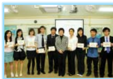
劉健儀議員評選「BOB」組為模擬選舉論壇的最佳表現小組。