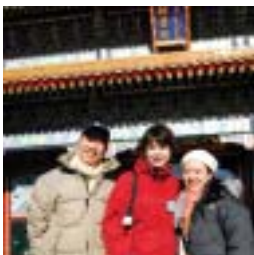
老師們到頤和園參觀。