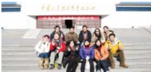
參觀抗日戰爭紀念館，了解抗戰的歷史。