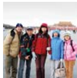
08年的第一天，到天安門廣場看升國旗。