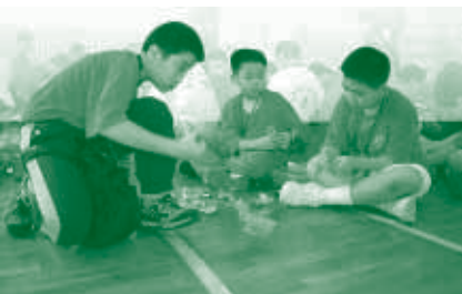
大會頒布了工程設計比賽的題目後，三位小學生即心無旁騖地投入比賽。

出發前，兩間學校的師生均抱著認真的態度為是次比賽作充分的準備，這不但為他們迎接比賽中的強勁對手先打下一個穩健的基礎，更讓他們明白到團隊合作的重要性。能於比賽中勇奪多個獎項，對各參賽學生來說，固然是對他們所付出努力的一個肯定，以及一個很大的鼓舞。是次參與全國賽，相信更讓他們有一個擴闊視野及與全國各地研究機器人的精英份子互相交流和切磋的好機會，這絕對是一個難得的經驗。