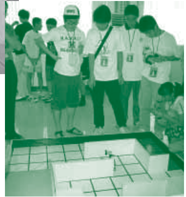
中學組的學生於比賽前到場地測試及調較機器人，看看他們多專心！

由中國科協主辦的「中國青少年機器人競賽」乃一個全國性的大型機器人比賽，今年已踏入第五屆，旨在培養青少年創新精神和動手實踐能力，增強他們發現並解難的能力。本會今年受到「中國科協」的邀請，並在「雅集出版社」的熱心贊助下，繼去年後再一次邀請並帶領中學及小學的師生代表香港特別行政區迎戰這個全國機器人比賽，與從內地各省市的地區性機器人比賽中勝出的頂尖分子一較高下。