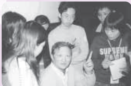
同學們就連小休時間也不放過，圍著教授發問問題。

國情培訓課程雖是多方面的，卻又是互相連結的。談談中國的經濟，又會論到中國的改革開放。說起社會主義，又會講及共產黨。討論中國法律的同時，又會涉及貪污問題。雖是分開七個大題目，卻又是同歸於一，那課題就是：中國到底是怎麼樣的。每位清華教授都是見解精闢，學識淵博，對歷史、對時事都有極深入的了解，並且能夠深入淺出地教授這個極艱深的課題。於這課題上，可能每一個人上課時都有不同的得著，有的可能吸收得多一些，有的可能吸收得少一些，然而在分享會中，各人互相分享、討論時，便可取長補短，集各家大成於一身，不但做到互動式的學習，而且更帶動了良好的學習氣氛，只要看看每天上課時的發問時間，便可知道這個課程有多成功了。