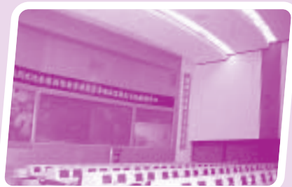
中國航天指揮控制中心，把我們的升空夢想實現！