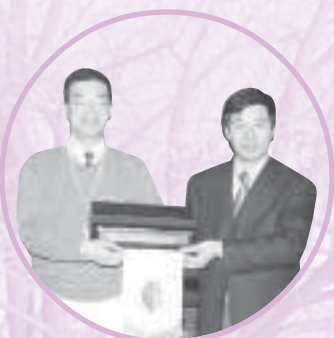
團長與全國青聯副秘書長倪邦文先生 互贈紀念品。

除了每天早上三個小時的課堂外，我們更有極之與別不同的參觀活動。就好像參觀警衛三師的軍事表演，軍人們整齊一致的步操、槍槍中靶的實彈射擊、拳拳到肉的近打搏擊、震耳欲聾的高射大炮，以及精采萬分的反恐演習，無不令我們嘩聲四起、讚嘆不已。我們又參觀了燕京啤酒廠—全國最大啤酒生產企業、中國航天指揮控制中心—中國首位太空人楊利偉在“神舟”五號與中國聯繫通信的地方，以及北京市木樨園體育運動技術學校—中國奧運金牌選手的訓練基地。能夠參觀完善管理的國有企業、艱苦訓練的體育訓練基地，以及代表國家最高航天科技的航天指揮中心，對我們著實有極大的鼓舞作用。除此之外，我們更拜訪了全國政協、全國青聯及民主黨派人士，我們不但可以近距離去了解不同組織的運作，更可以擴闊我們對不同黨派的認識，機會十分難能可貴。