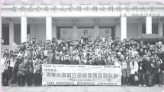
150位「明日領袖」來到清華，認識祖國！

事實上，要帶領一個150人的團隊絕對不是易事，不但極之講求團體合作、行動迅速及一致，更需要服從大會及組長的指示，才能使整個活動順利完成。可幸的是，這150人完完全全地達到以上的要求，實在非常值得稱讚。或許大會的安排未算十全十美，但即使行程安排得近乎完美，若沒有大家的通力合作以及投入的話，也只會白費心機。