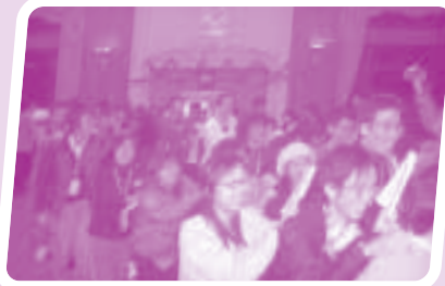
與清華同學一同歡渡聖誕！