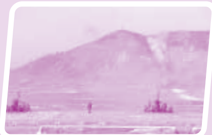
大炮轟隆一聲擊中山上的目標，非常厲害！