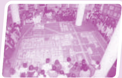
大家圍著觀看燕京啤酒廠的規劃模型。