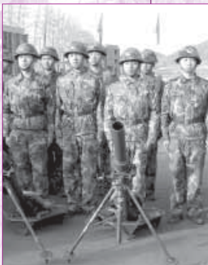
整齊的軍人不怕嚴寒、一動也不動地站著給我們拍照。

能夠跟清華的同學有交流的機會，觀看軍事表演和會見全國政協副主席，使我感到十分興奮。我只是一位渺小的香港學生，從沒想過能夠親眼目睹這國家級的表演和講座，這使我印象難忘。最令我印象深刻的是軍事表演，他們步伐整齊，按指辦事，那份守紀律的精神，實在值得我們年輕人學習。