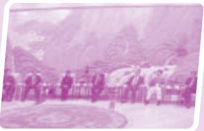
與全國政協副主席羅豪才座談。

除了每天早上三個小時的課堂外，我們更有極之與別不同的參觀活動。就好像參觀警衛三師的軍事表演，軍人們整齊一致的步操、槍槍中靶的實彈射擊、拳拳到肉的近打搏擊、震耳欲聾的高射大炮，以及精采萬分的反恐演習，無不令我們嘩聲四起、讚嘆不已。我們又參觀了燕京啤酒廠—全國最大啤酒生產企業、中國航天指揮控制中心—中國首位太空人楊利偉在“神舟”五號與中國聯繫通信的地方，以及北京市木樨園體育運動技術學校—中國奧運金牌選手的訓練基地。能夠參觀完善管理的國有企業、艱苦訓練的體育訓練基地，以及代表國家最高航天科技的航天指揮中心，對我們著實有極大的鼓舞作用。除此之外，我們更拜訪了全國政協、全國青聯及民主黨派人士，我們不但可以近距離去了解不同組織的運作，更可以擴闊我們對不同黨派的認識，機會十分難能可貴。