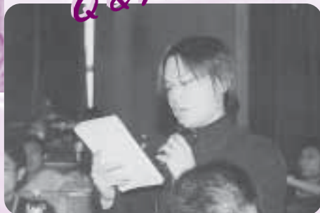
同學們在每天的 Q & A 時間都勇於發問。

國情培訓課程雖是多方面的，卻又是互相連結的。談談中國的經濟，又會論到中國的改革開放。說起社會主義，又會講及共產黨。討論中國法律的同時，又會涉及貪污問題。雖是分開七個大題目，卻又是同歸於一，那課題就是：中國到底是怎麼樣的。每位清華教授都是見解精闢，學識淵博，對歷史、對時事都有極深入的了解，並且能夠深入淺出地教授這個極艱深的課題。於這課題上，可能每一個人上課時都有不同的得著，有的可能吸收得多一些，有的可能吸收得少一些，然而在分享會中，各人互相分享、討論時，便可取長補短，集各家大成於一身，不但做到互動式的學習，而且更帶動了良好的學習氣氛，只要看看每天上課時的發問時間，便可知道這個課程有多成功了。