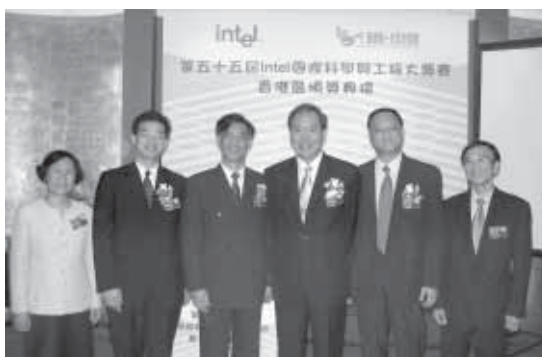
本會董事於香港區頒獎典禮上與主禮嘉賓李國章局長合照。

5月22日，本會假萬豪酒店舉行了Intel ISEF 香港區頒獎禮，並榮幸邀得教育統籌局局長李國章教授蒞臨主禮及頒獎。此外，大會還邀請了隨團科學顧問香港中文大學方永平教授與我們分享這次美國Intel ISEF之行的心得；而10位參賽同學亦一一分享了他們的感想收穫？不只是獎項！來聽聽他們怎麼說！