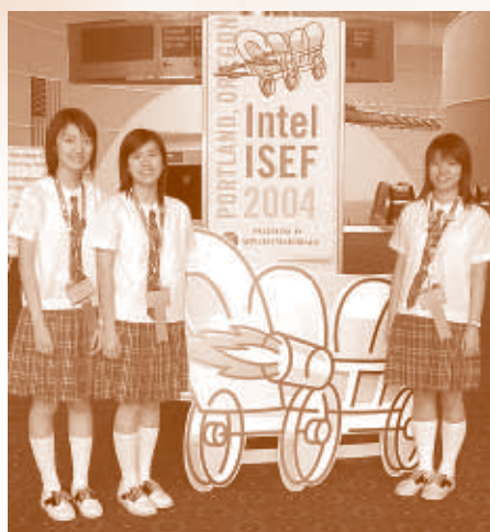
04年賽事於美國Portland, Oregon 舉行。

本會原定於去年5月組織香港學生第一次參與這項大型國際賽事，因SARS疫情影響而未能成行。連同去年入圍的三項優秀作品，今年共有六項作品於5月8-19日赴美國波特蘭（Portland, Oregon）參加「Intel 國際科學與工程大獎賽2004」。這是香港學生第一次參與這項賽事，並取得一項二等獎及兩項四等獎，成績斐然，令人鼓舞。