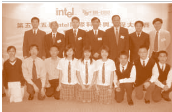
出發前的新聞發佈會。