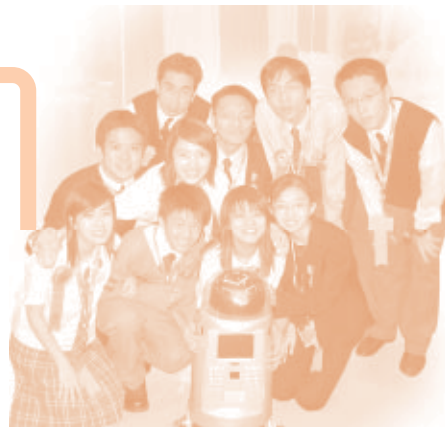
10位團員互相照顧，團結一致。

頒獎典禮的規模宏大，可以媲美奧斯卡。當台上傳出自己的名字，身邊的人都在高聲鼓掌，我和組員手牽手走到台上。台上強烈的燈光使我看不到台下的人，只能聽到震耳欲聾的掌聲，轉眼看到我兩位組員都感動得落淚，在台下我的老師拿着相機對我們微笑，此時我也禁不住哭起來。其實我真的非常感謝我的組員，我們合作一年多了，其中有數之不盡的苦與樂。我們試過一起通宵做project，在電話內罵戰，也有曾想過放棄……幸好最後我們也一起越過重重的障礙，現在她們已成為我最好的朋友。我也非常感激我的老師，她一直在背後默默支持我們，也給予我們很多空間發展，令我們變得更加成熟和獨立。