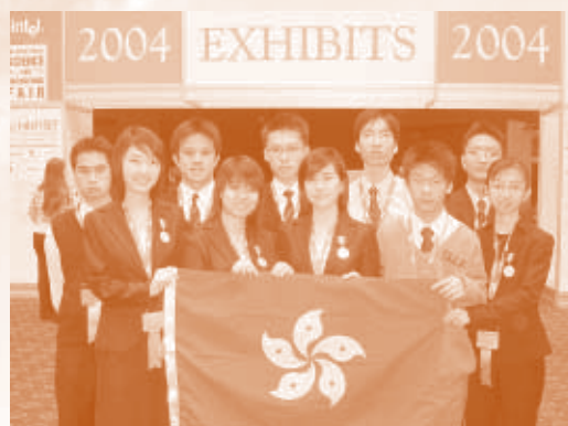
香港代表隊於會場門口合照。

「Intel 國際科學與工程大獎賽 2004」始辦於1950年，由Science Service主辦，每年由美國不同城市承辦，輪流舉行。每年均吸引來自40多個國家和地區的1200餘名高中生，1000多個研究項目參與競賽。