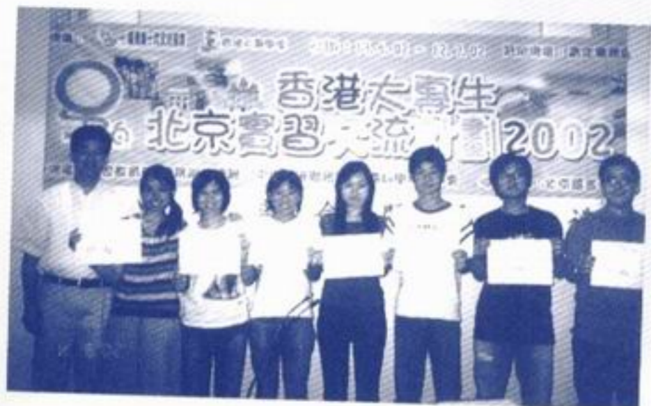
終於完成活動了，我們畢業啦！

我們一眾學壇幹事能夠參與是次活動的籌辦，都感到很榮幸，而且獲益良多，大家在處理困難和人際關係方面也成長了不少。我們從策劃至宣傳至活動正式舉行，都遇到不少困難和憂慮，大家有時也難免意見分歧和發生爭執，慶幸大家都能積極面對，互相包容和提點，使問題得以解決，活動也得以順利進行。經過一個月的相處，我們相互了解和熟絡了不少，大家回到香港後，常常ICQ，並不時出來聯誼和當義工，我們還計劃到南丫島宿營呢！籌辦實習計劃的過程是一個很好的學習機會，是一個很美好的回憶，而在北京一個月的生活都使我們很回味，將來我們閒談時必定會不時提起北京生活的片段、提到籌備過程的苦與甜。