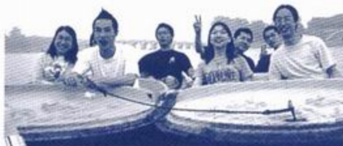
搖呀搖，搖到十七孔橋...看！大家搖得多高興！