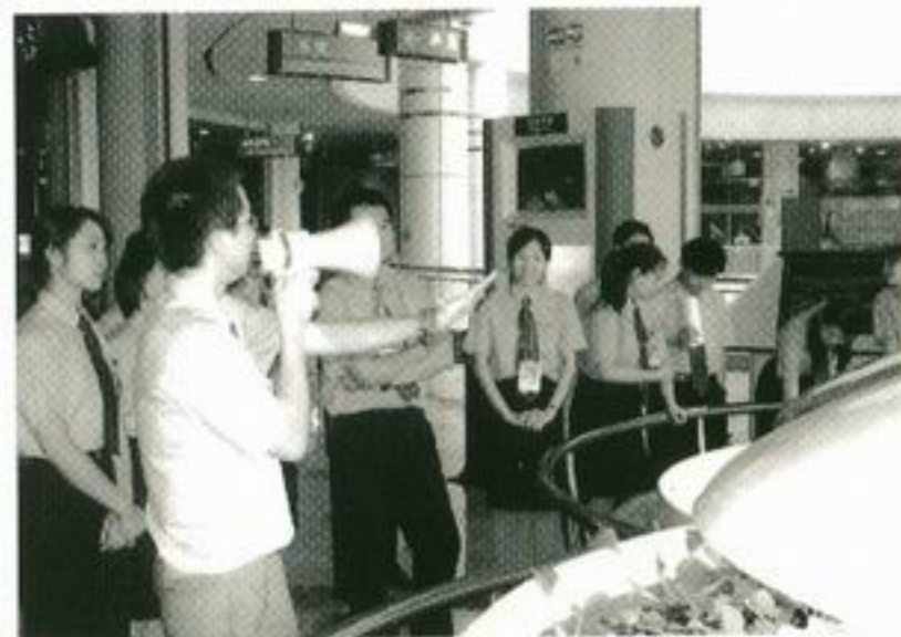
同學在中國科技館實習時向參觀人士講解館內的展品。

實習交流計劃的主題是「全方位認識祖國，多層次裝備自己」，活動內容分為四部分，包括實習、課程、交流和參觀考察。實習方面，大會安排了北京十三個機構的職位，讓參加者大展所長，感受一下在內地工作的滋味。有些實習機構的領導很熱情，為同學舉行歡迎會、送別會，又或新添桌椅、贈送紀念品予同學等。此外，有些同學在工作期間被安排到農村、開發區和城鎮出差，也有同學在報社工作，有機會訪問當地名人和撰寫稿件，有些同學更和同事商量工作時，學習到內地的工作文化，也建立了友誼。