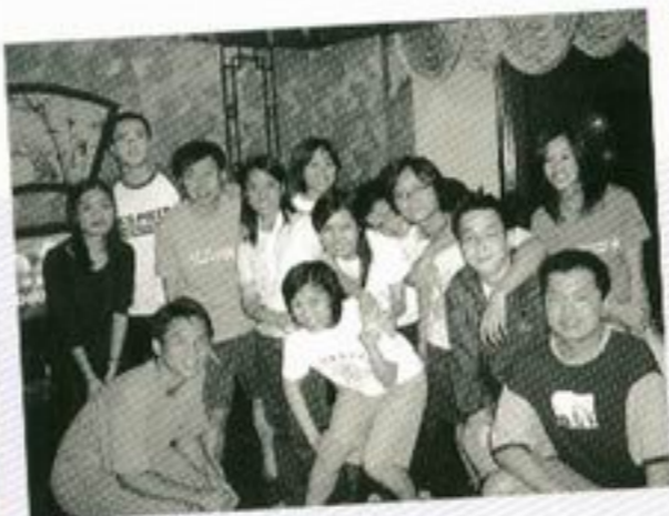
各就位……1, 2, 3笑！