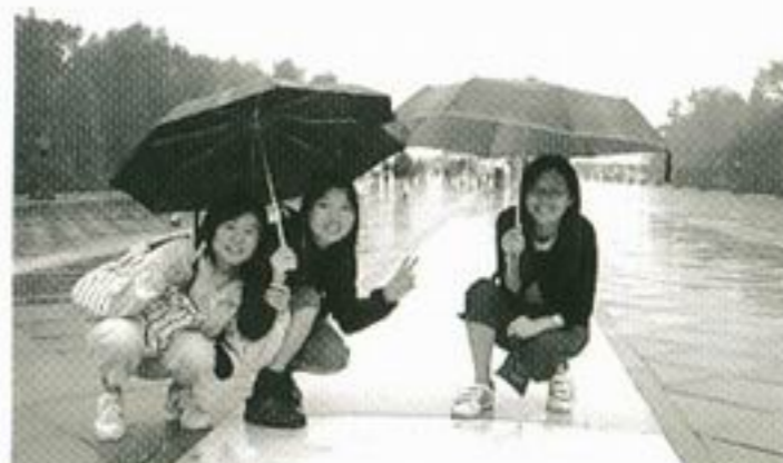
雖然下著雨，但也不減我們遊歷天壇的心情呢！