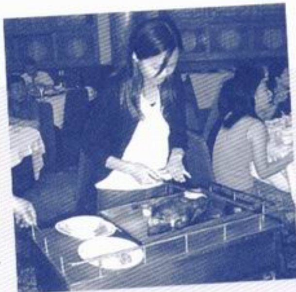
同學去到北京一個月，連整「北京填鴨」都學識埋？果然似模似樣啲！

此外，除了大會為同學安排節目外，同學也自發組織很多活動，如籃球比賽、生果會、麻雀會、卡拉OK、食烤鴨、打保齡球、看世盃球賽、逛商場、吹水、UNO、鋤大D等。經過一個月的接觸和溝通，很多同學都不知不覺成為好朋友，並很珍惜大家的友誼，即使返回香港，大家也常常出來聚會，保持聯絡，這份友誼對很多營友來說，都是一個很豐富的收穫。