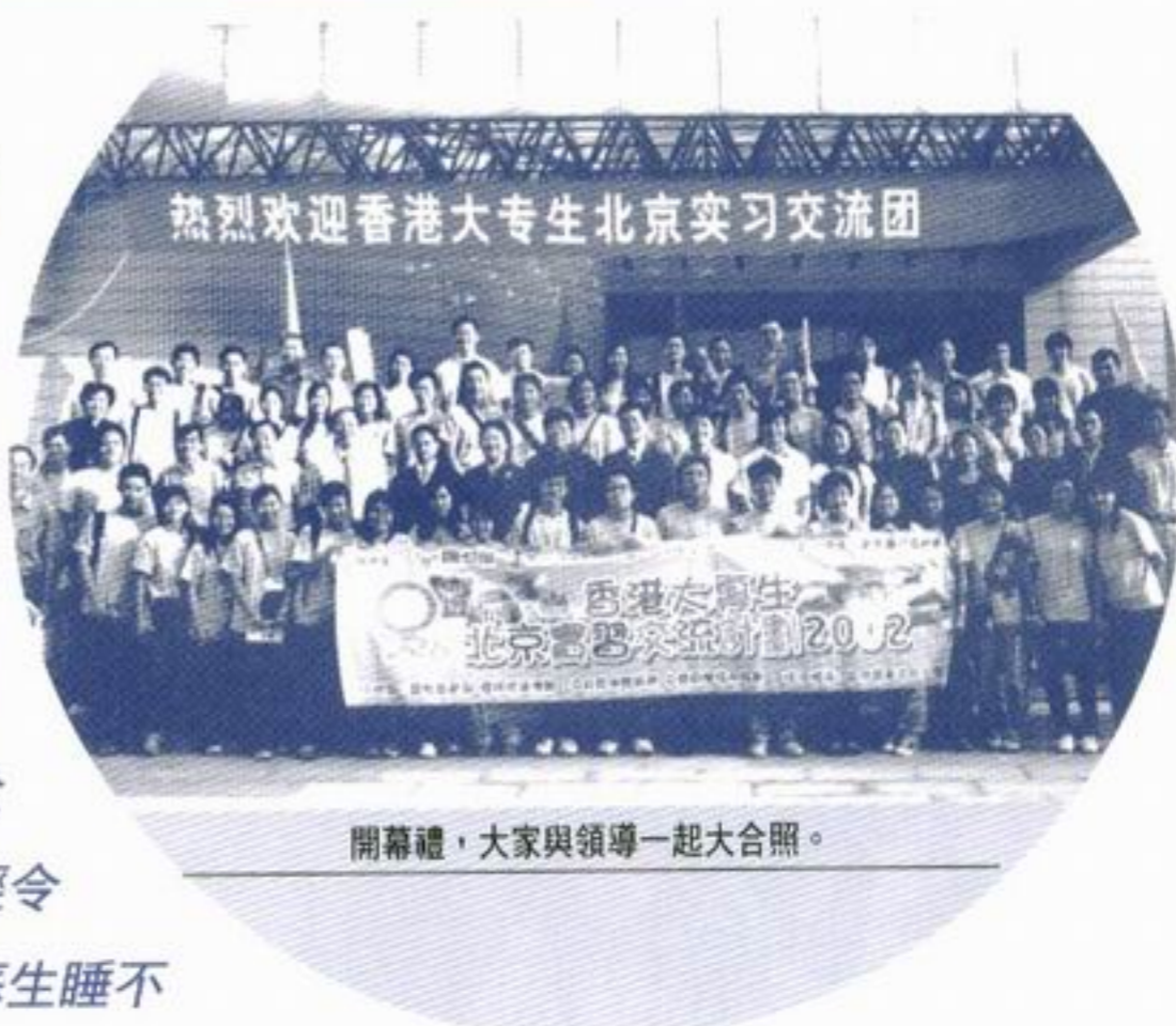
開幕禮，大家與領導一起大合照。

是次實習交流計劃於六月中至七月中舉行，吸引了近四百名大專生報名參加，我們面試各參加者後，便挑選了五十人參與是次活動。五十名參加者來自八間大專院校，大家各有所長，在北京一同學習，一同生活，互相扶持了一個月，期間大家都從各人身上學曉了很多，也建立了很深厚的感情。