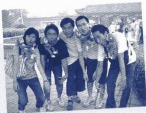
大家能數出相片中有多少猩猩嗎？

港回歸五周年，部分同學被中青網邀請，在網上大談回歸後的感受。此外大會也安排同學到天安門觀升旗，當天大家都混入來自五湖四海的同胞當中，擠得水洩不通，慶幸大家都沒有受傷，並能窺見升旗場面的莊嚴。