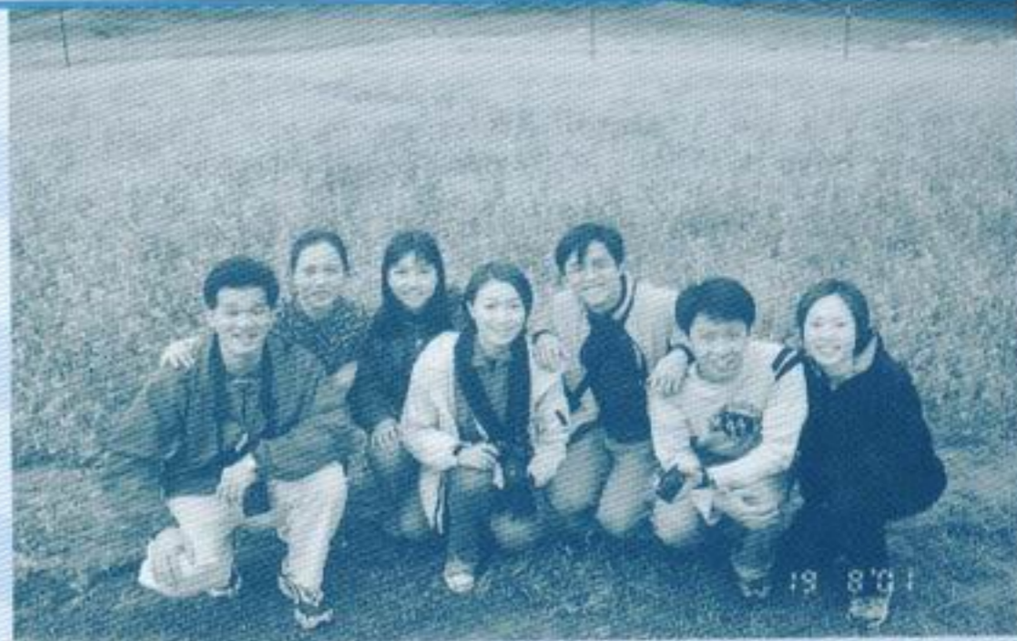
在一大片油菜花前拍照，人都靚啲。