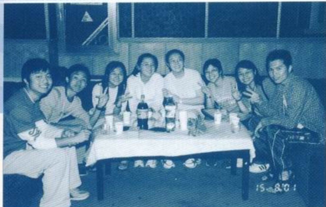
我們與青海學生交流聯歡的一個晚上，多開心啊！