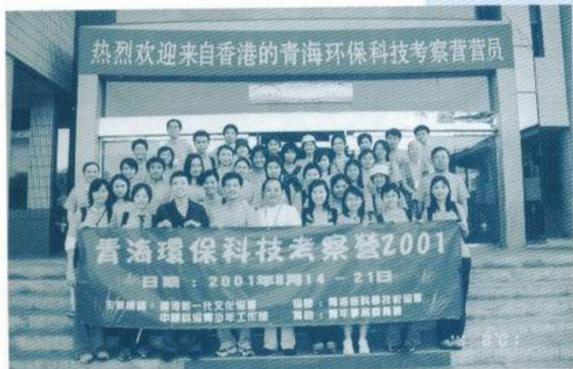
來吧！一起在小島基地的門口拍第一張青海大合照。

是次考察活動以「環保、科技」為主題，由香港新一代文化協會與中國科協青少年工作部聯合主辦，於八月十四日至二十一日在青海省舉行，並得到青海省科協的大力支持。