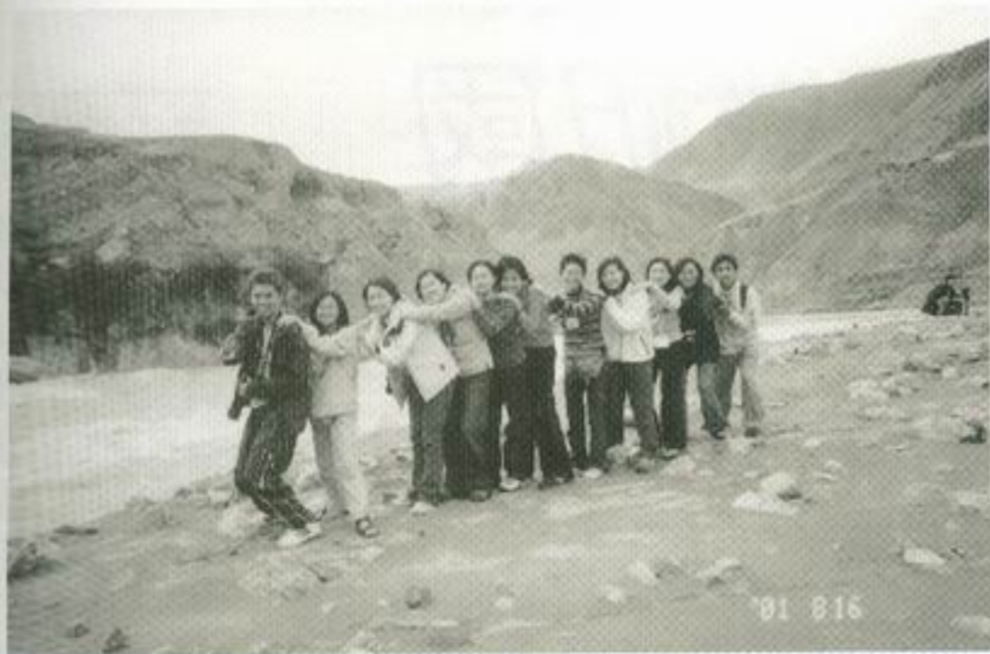
嗚…嗚…，怎麼在黃河邊也有火車呢？