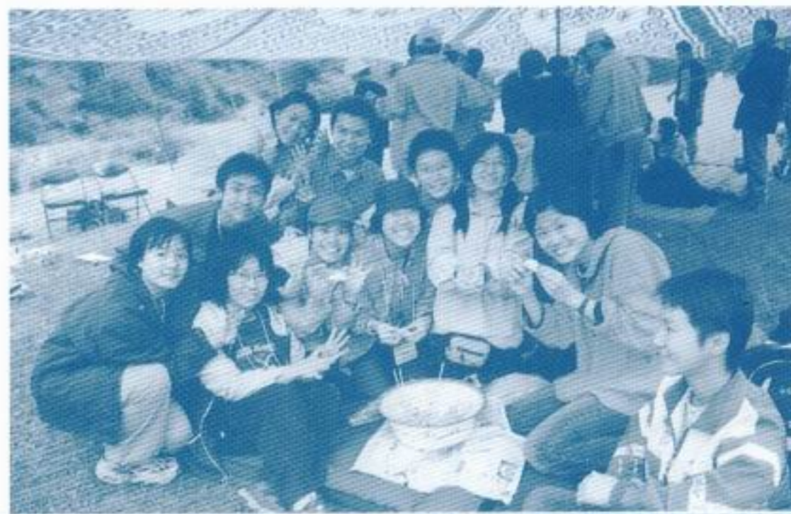
在高原包餃子，別有一番風味。

在出發前，我們大多數人不其然對青海省的高原環境感到忐忑不安，因為大家也預測是次行程將會十分艱苦，並不斷提醒自己一定要作好充份的心理準備。幸而，得到青海省科協的悉心安排，我們受到貴賓式的款待，在此要感謝他們在旅程中的照顧。在那裡我們體驗到青海人民的辛勞生活和堅毅的性格，他們的恆心是十分值得我們學習的。