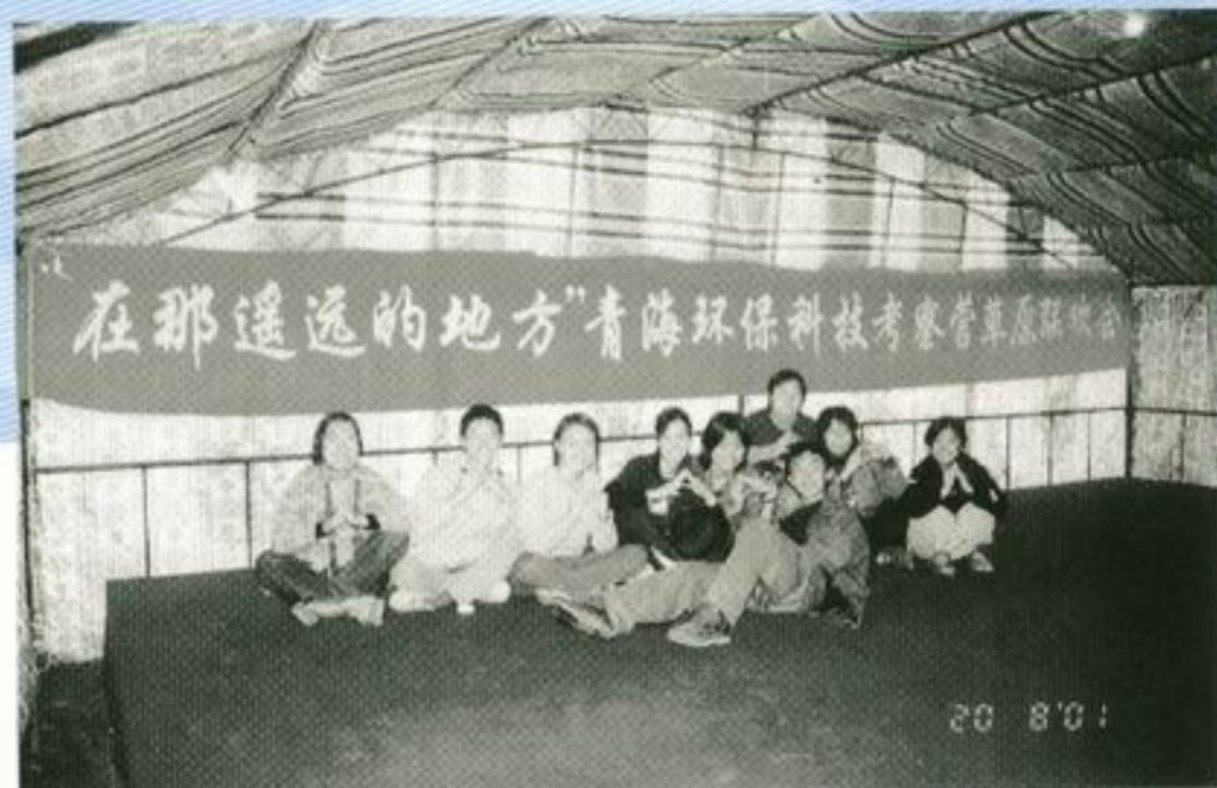
我們到「在那遙遠的地方」舉行草原聯歡會。