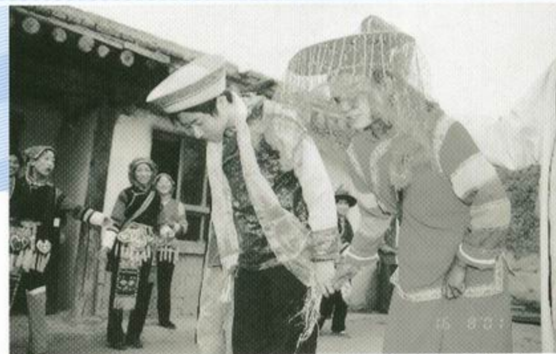
我們到土族探訪時，有幸能看到土族人正在舉行婚禮。