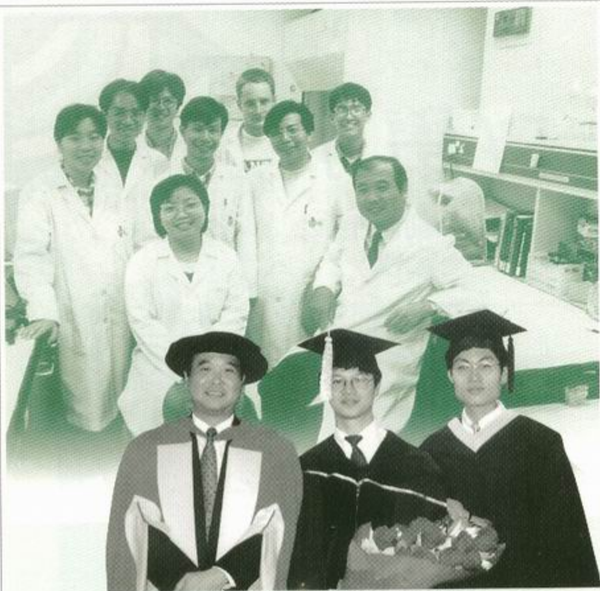
黃教授與他的博士生和研究生。