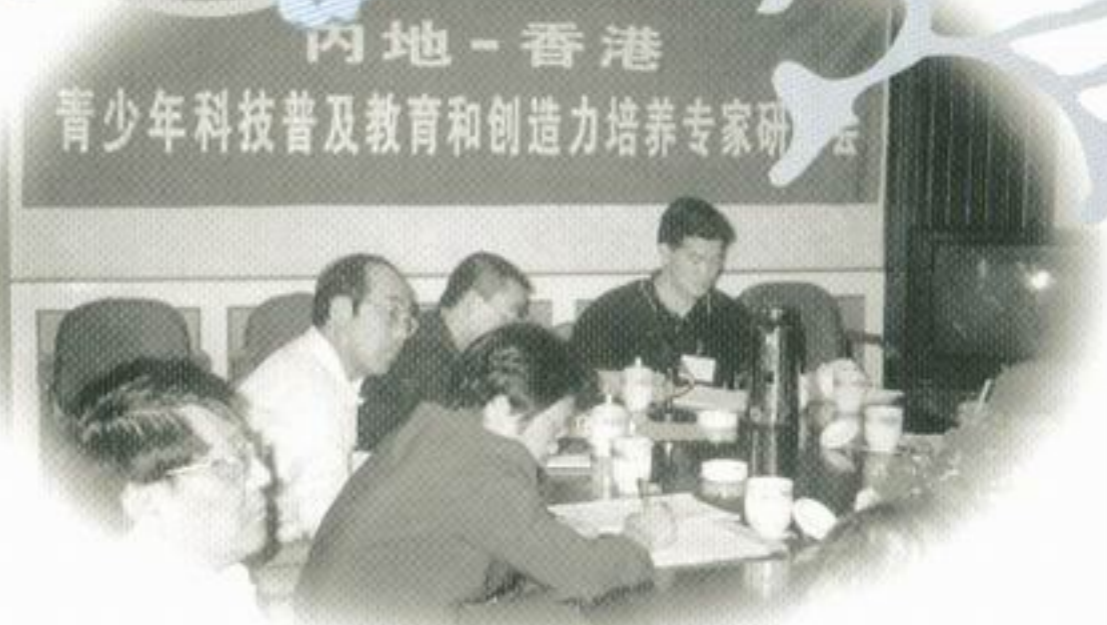
熱心的參加者正在討論如何發展中港兩地的青少年科普教育工作。

之所以說它是一個非一般的交流團，是因為除了一般交流團通常都有的參觀、考察、遊覽、座談之外，更特別的是，在活動期間，主辦機構和支持機構聯合辦了一個專題研討會——「青少年科技普及教育和創造力培養研討會」。來自全國各地的專家學者齊集昆明市，共同探索青少年科技教育和創造力培養的新方法、新途徑。出席代表來自北京、浙江、江蘇、廣東、湖北、雲南、香港等省市和地區，包括中國科普研究所副所長陳宏規研究員、中國政法大學副校長馬抗美教授、教育部科技司陳冬生處長、全國教育科研規劃領導小組辦公室常務副主任金寶城先生、國務院港澳辦吳煒副處