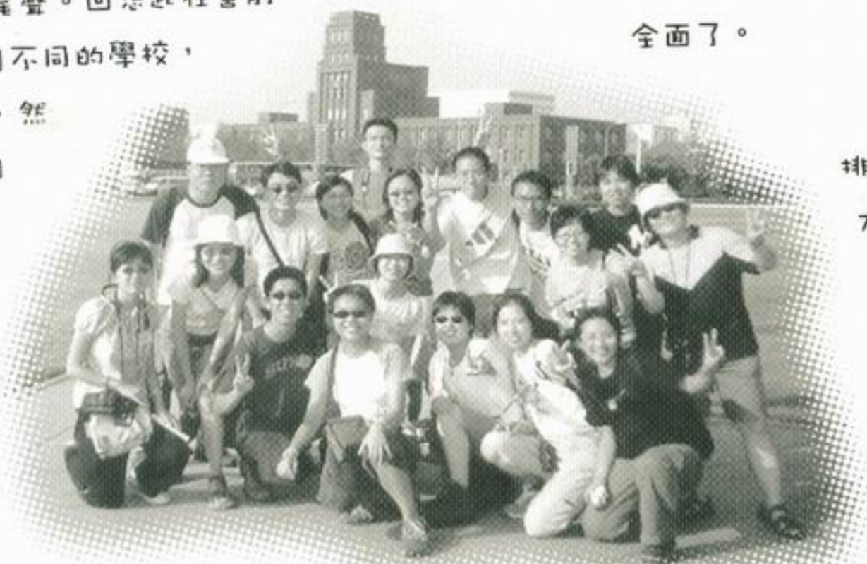
在綠草如茵的人民廣場體驗大連的「廣場文化」及環保工作的成果。

我們看到大連的完善規劃，威海的環保決心，青島的工業旅遊齊步發展，與我們印象中歷史悠久的中國古城很不同。由此，我們對祖國的認識也就更為全面了。