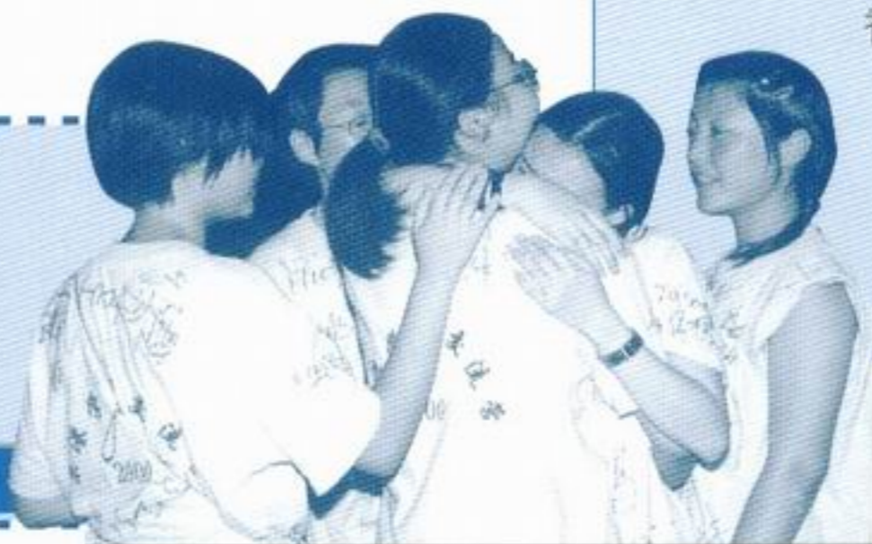
臨別的一刻，同學們抱頭 痛哭，難捨難離。