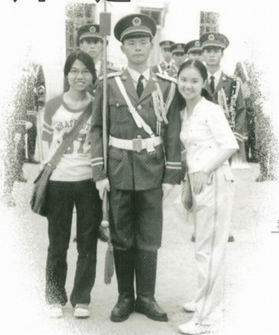
威風凜凜的解放軍 和嬌俏的香港女營員。