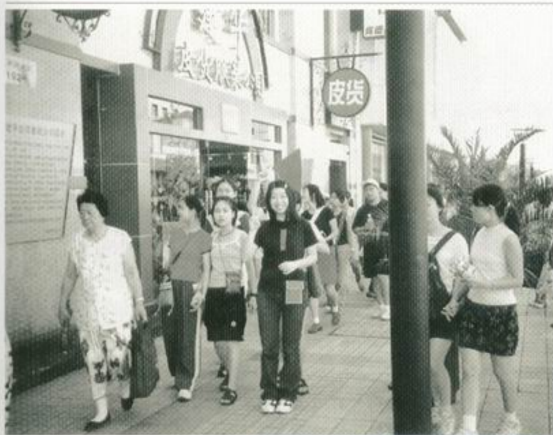
「買、買、買！」香港學生在王府井大街購物時的情況。

除了遊覽外，我們還參觀了北京郊區的順義區農村、中關村高科技園區和繁華的王府井大街，看到了新企業、新農村的成功例子，親歷了祖國在改革開放後發生的巨大變化。我們深深地被這全新的風貌吸引著，在路上一同祝福祖國能有更美好的未來。我們還觀看了莊嚴的升旗儀式，探訪了解放軍，並欣賞了他們精彩的軍事表演，感受到祖國強大的軍事實力。