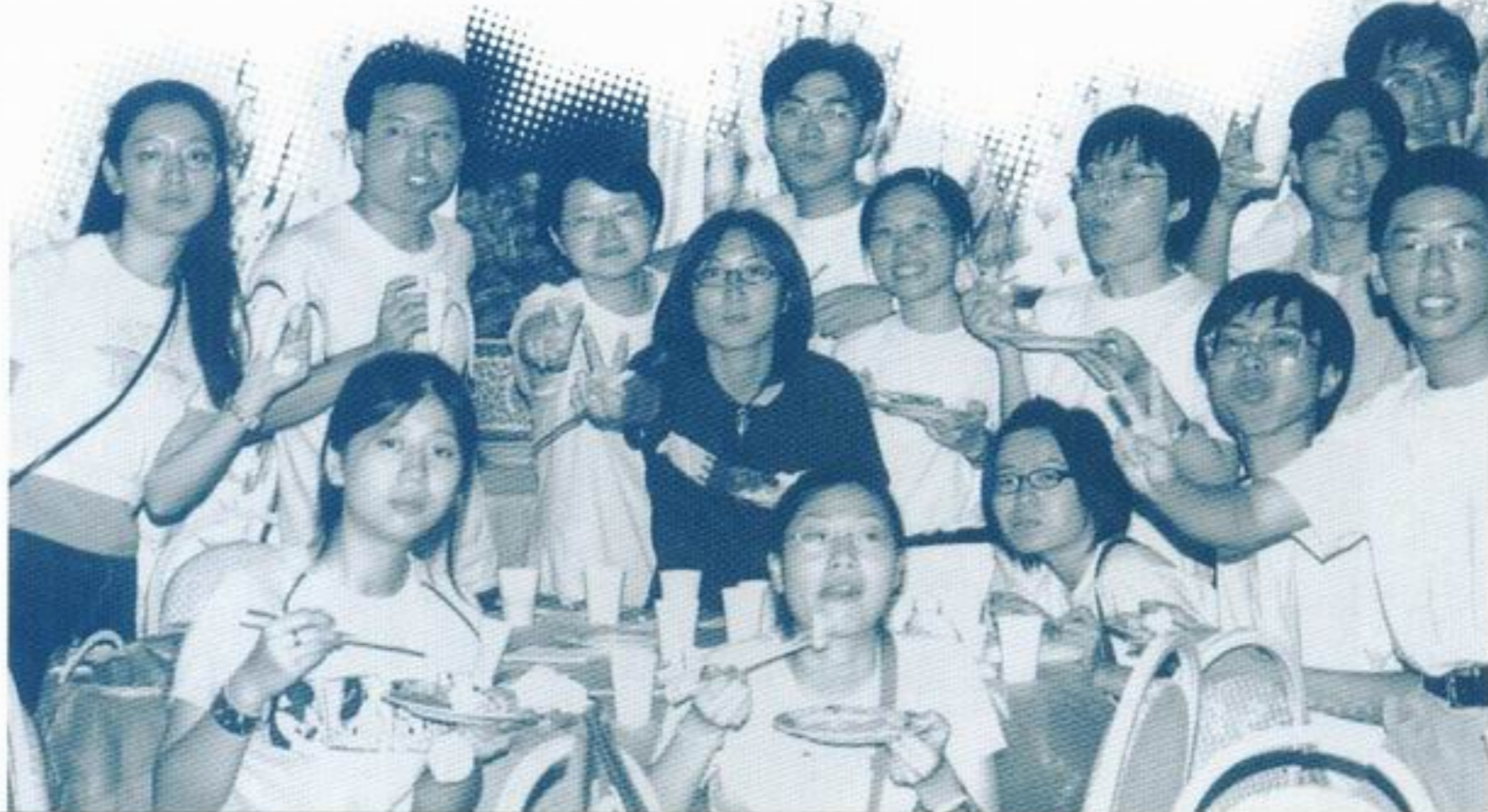
京港營友在享用美味的西式自助餐。

在話別的當天，有香港營員這麼說：「香港是我的家，但這裏給了我『國家』的感覺。」有北京營員這麼說：「作為邁向新世紀的新青年，祖國的繁榮和富強與我們的責任和使命緊緊相連。」因此，筆者深信是次活動讓香港的同學們理解了「我的祖國」的真正含意。營員們在日後定能繼續發揚取長補短、團結互助、攜手共進的精神，勇敢地承擔起時代賦予我們的使命和責任。