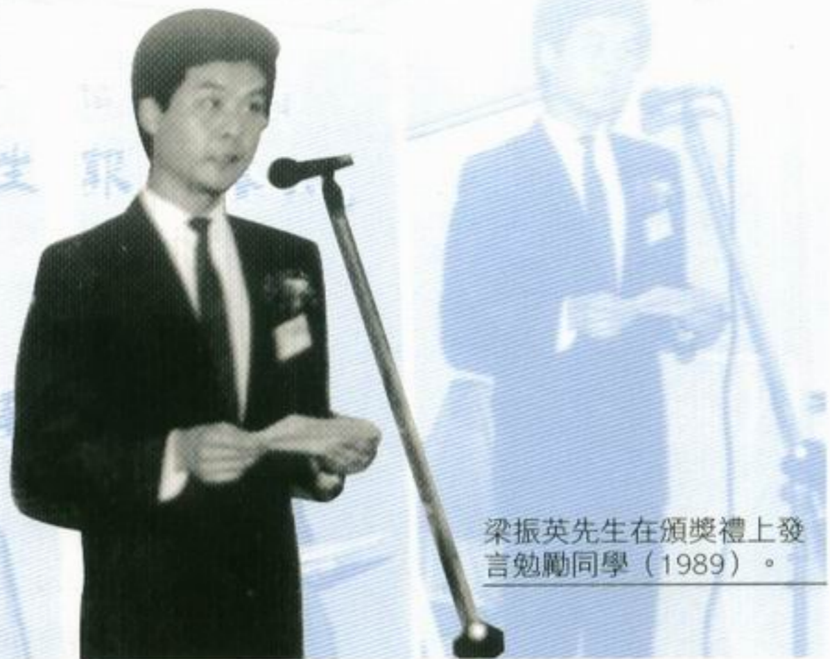
梁振英先生在頒獎禮上發言勉勵同學 (1989)。

梁振英先生在訪問中亦和我們分享了他的成功要訣。他認為要成為一個成功人士就必須擁有自己的專業，並且專注於自己的專業。